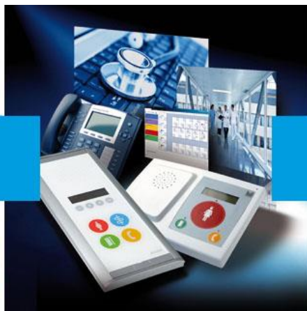
Sistemas paciente enfermera