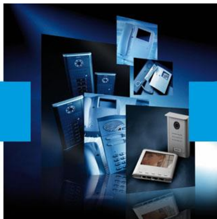
Control de acceso